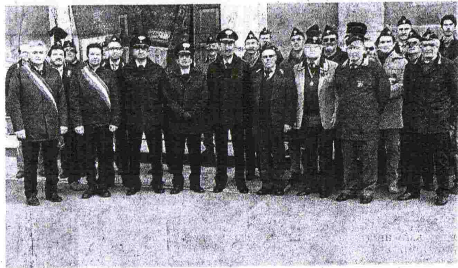
Parte dei tanti partecipanti alla «Virgo Fidelis» di domenica